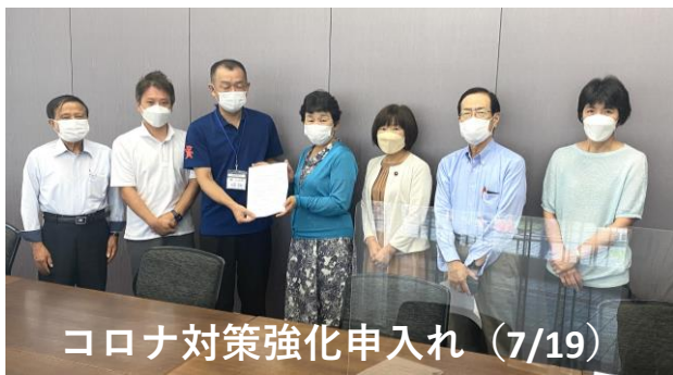
コロナ対策強化申入れ (7/19)